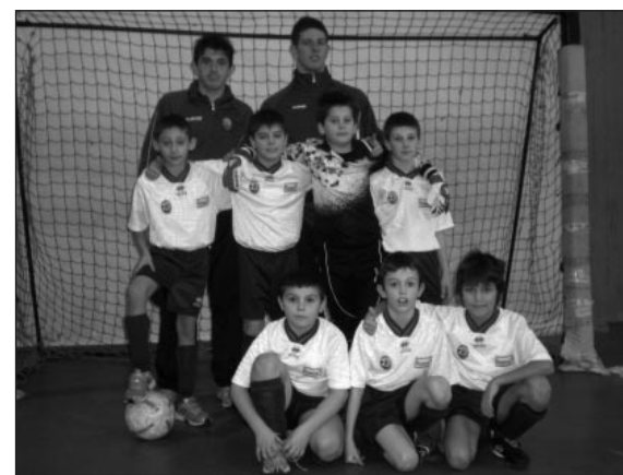
La Faloppiese si è imposta nella categoria Pulcini 2001