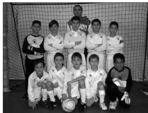
La formazione Pulcini 2000 dei Soccer Boys

Prossimo appuntamento il Torneo di Primavera che si disputerà sullo splendido campo in erba di Schianno (24 e 25 aprile, 1° e 2 maggio) con la partecipazione anche dell'Inter.